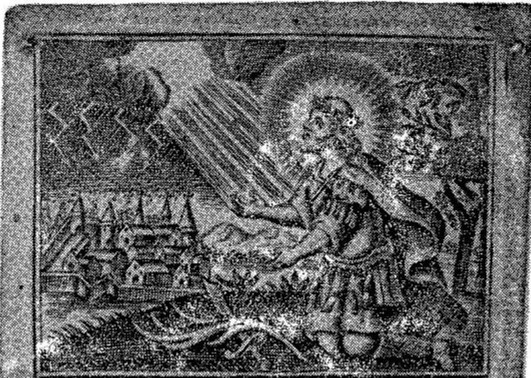
S. Carolus tegen „pestilentie”.