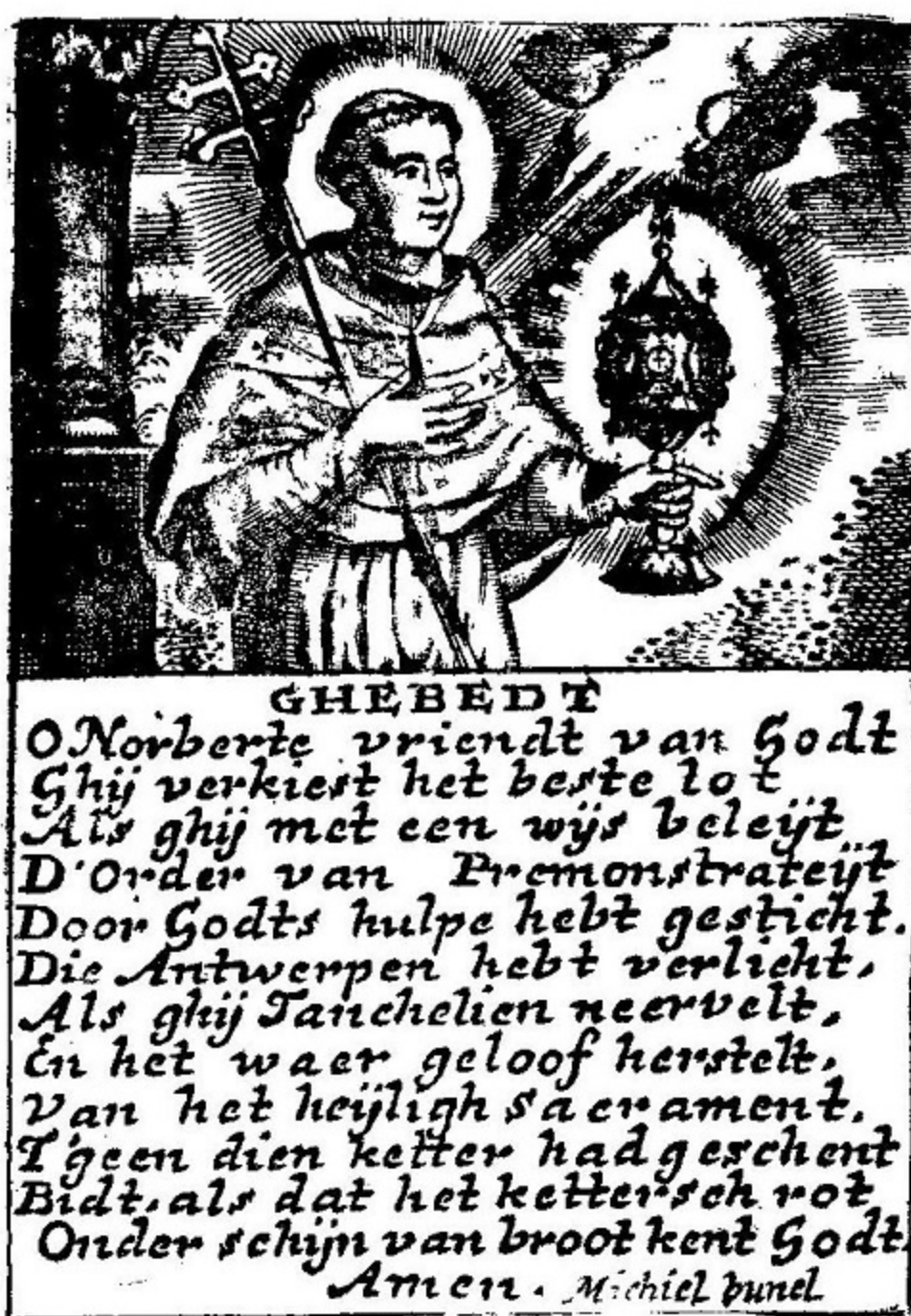
S. Norbertus met gebed.

De BIDPRENTJES-DOODSBEELDEKENS blijven buiten bespreking. Alhoewel hun gebruik in de tweede helft der 18e e. eerst in Noord- dan Zuidnederland aarzelend en sporadisch opduikt, gaan ze crescendo van 1800 tot 1975 de markt overrompelen ten gevolge van de moderne technieken der litho en allerhande methodes die op de fotografie steunen.