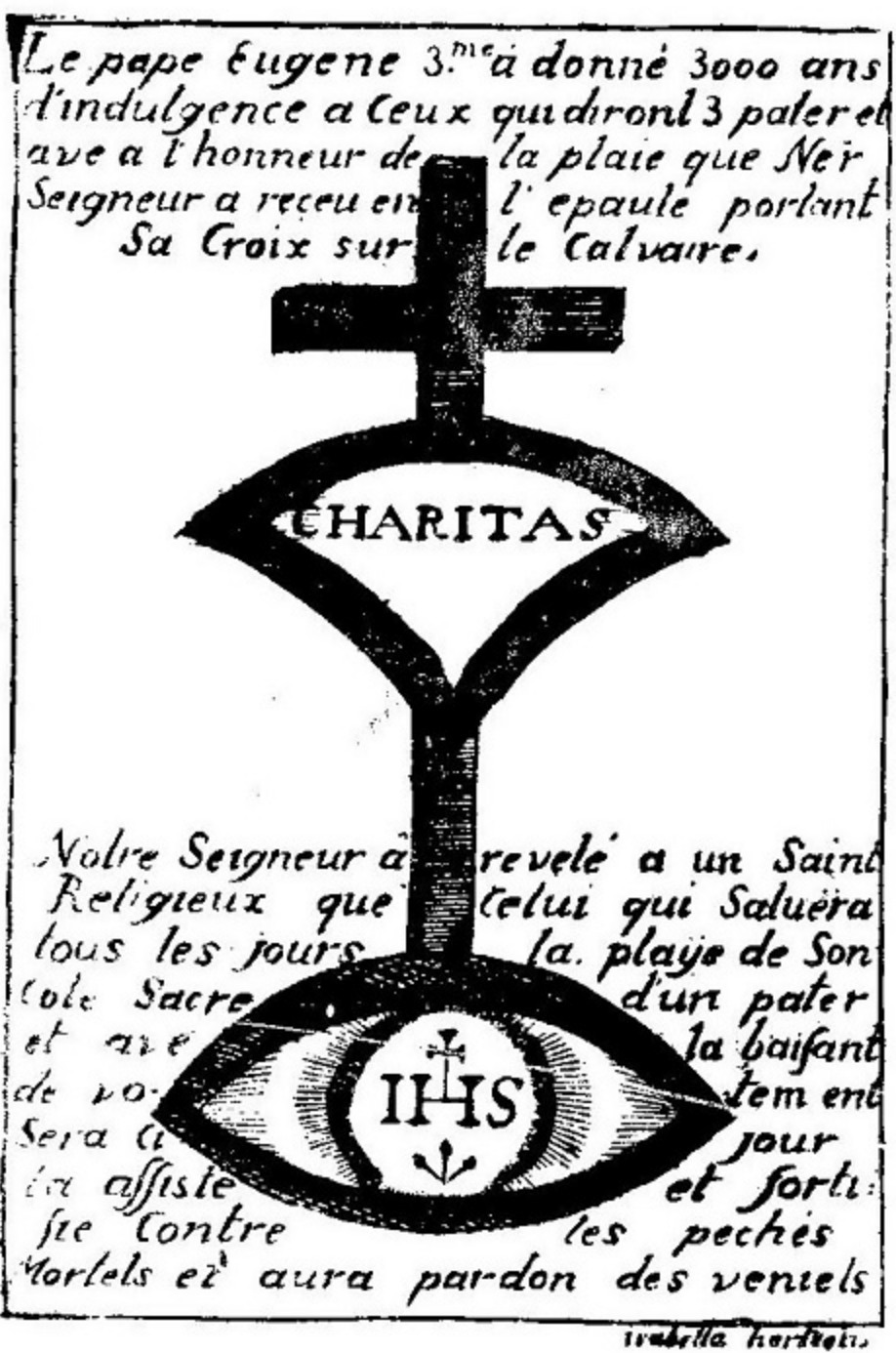
De H. Hart- en Schouderwonden. 3000 jaar aflaat, mits gebed. Uitg. Isab. Hertsens ca. 1750