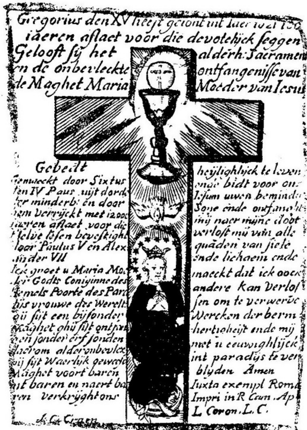
Het meest verspreide gebed. Kruis en O.L. Vrouw (100 jaren Afl.) Uitg. J.Ch. Craen (1779)

De burgerij en de hogere standen ken- den een variant van deze rijm- en aflaten- prenten, nl. de « SUFFRAGIEN ». Als een der eerste devotievormen die aan- leunen bij de Posttridentijnse Hervor- ming of Contra-Reformatie dienen de Congregaties voor mannen en vrouwen